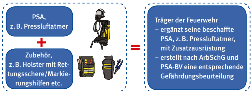
Bild 2: Anforderungen an die Kombination von Zusatzausrüstung und PSA

Wird eine Zusatzausrüstung mit einer PSA kombiniert, muss die Trägerin bzw. der Träger der Feuerwehr durch eine Gefährdungsbeurteilung feststellen und prüfen, ob die Schutzwirkung der PSA weiterhin gegeben ist, bzw. inwieweit weitere neue Gefährdungen durch die Kombination entstehen. Die Gefährdungsbeurteilung nach Arbeitsschutzgesetz und PSA-Benutzerverordnung ist zu dokumentieren.