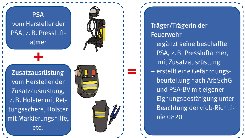
Bild 3: Anforderungen an die Kombination von Zusatzausrüstung mit PSA

Kombiniert der Träger bzw. die Trägerin der Feuerwehr eine nach der vfdb-Richtlinie 0820 für geeignet erklärte und gelistete Zusatzausrüstung, stellt die Bestätigung auf Basis der Prüfung und Bewertung nach vfdb-Richtlinie 0820 einen wesentlichen Bestandteil seiner bzw. ihrer Gefährdungsbeurteilung nach ArbSchG und PSA-BV dar (siehe Bild 3).